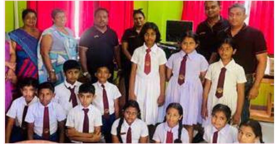
ஹட்ச் நிறுவனம், இலங்கையில் டிஜிட்டல் அறிவை மேம்படுத்துவதில் அர்ப்பணிப்புடன் உள்ளது. தனது அர்ப்பணிப்புக்கு அமைவாக, தனது நிறுவன சமூகப் பொறுப்புணர்வுச் செயற்பாடுகளின் ஒரு அங்கமாக, மினுவாங்கொடையிலுள்ள ஆரங்காவ ஸ்ரீ தம்மாராம ஆரம்ப பாடசாலைக்கு டெஸ்க்டாப் கணினிகளை அது வழங்கியுள்ளது. சர்வதேச எழுத்தறிவு தினத்தை யொட்டியதாக, காலத்திற்கு ஏற்ற இந்த முயற்சி, தொழில் நுட்பத்தினூடாக கல்விக்கு ஆதரவளிப்பதில், குறிப்பாக