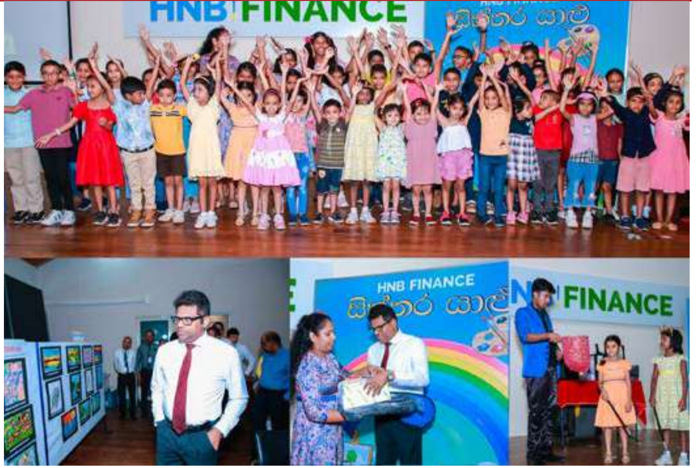
குழந்தைகளுக்கும் மதிப்புமிக்க பரிசுகள் மற்றும் சான்றிதழ்களை வழங்க ஏற்பாடு செய்துள்ளதுடன் சேமிப்புப் பழக்கத்தை