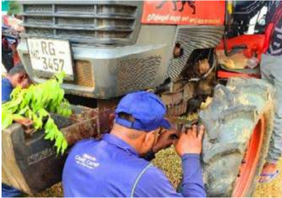
வகையான உழவு இயந்திரங்களுக்கும் வாய்ப்பு வழங்கப்பட்டமை ஒரு விசேட அம்சமாகும். இவ்வருடம் நாட்டிலுள்ள முக்கிய விவசாய மாவட்டங்களை இலக்காகக் கொண்டு இந்த நிகழ்ச்சித்தொடர் முன்னெடுக்கப்பட்டது.

பெரும் போகத்திற்குத் தயாராகி வரும் விவசாயிகளுக்கு உதவும் வகையில் DIMO நிறுவனம் இலவசமாக இரண்டாவது தடவையாக முன்னெடுத்திருந்த 'DIMO Care Camp' உழவு இயந்திர சேவை முகாம் அண்மையில் வெற்றிகரமாக நிறைவு பெற்றதோடு, இதில் பெருமளவான உழவு இயந்திர உரிமையாளர்கள் பங்குபற்றியிருந்தனர். விவசாய நடவடிக்கைகளின் செயல்திறன் மற்றும் தரத்தை பேணுவதற்கு, விவசாய இயந்திரங்களின் முறையான பராமரிப்பு மிகவும் முக்கியமானதாகும். அந்த வகையில் இந்நாட்டின் விவசாயிகளுக்கு தமது பங்களிப்பை வழங்கும் நோக்கில் முன்னெடுக்கப்பட்ட இந்த இலவச சேவையில், எந்தவொரு வர்த்தகநாமத்தைச் சேர்ந்த அல்லது எந்தவொரு