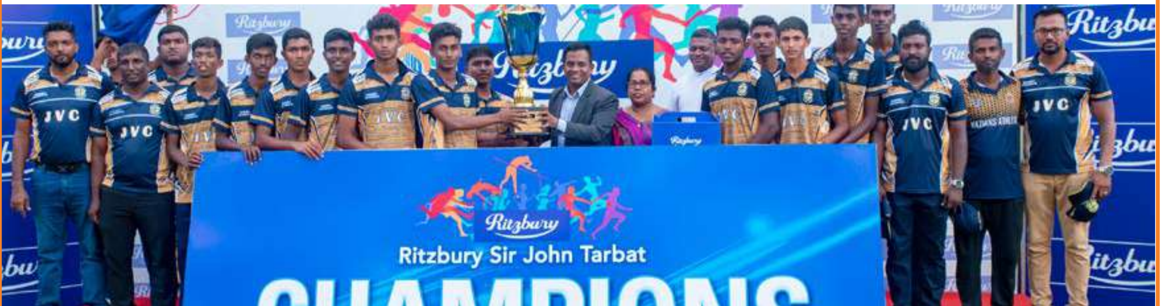
92ஆவது ரிட்ஸ்பரி சேர் ஜோன் டாபர்ட் சிரேஷ்ட தடகள சம்பியன்ஷிப் 2024 போட்டிகள் செப்டம்பர் 30ஆம் திகதி முதல் ஒக்டோபர் 3ஆம் திகதி வரை கொழும்பு சுகத்தாஸ மைதானத்தில் நடைபெற்றன. இந்த போட்டியில், நாட்டின் சிறந்த தடகள வீரர்கள் தமது திறன்கள்