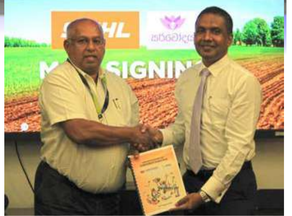
20% முற்பணத்தையும் Tea Pruner உபகரணங்களுக்கு

உபகரணங்களை கொள்வனவு செய்வதற்குப் பதிலாக, அத்தியாவசிய உபகரணங்களில் நிதியை முதலீடு செய்வதற்கான எளிய வழிகளை இந்த தீர்வுகள் வழங்குகின்றன. இது விவசாயிகளின் பொருளாதார நிலையை கணிசமான வகையில் மேம்படுத்த உதவுவதோடு, பயிரிடல் மற்றும் ஏனைய அடிப்படைத் தேவைகளில் விவசாயிகள் முதலீடு செய்யவும் உதவும். இந்த குத்தகை சலுகையைப் பெறும் வாடிக்கையாளர்கள் Tiller Machines உபகரணங்களுக்கு