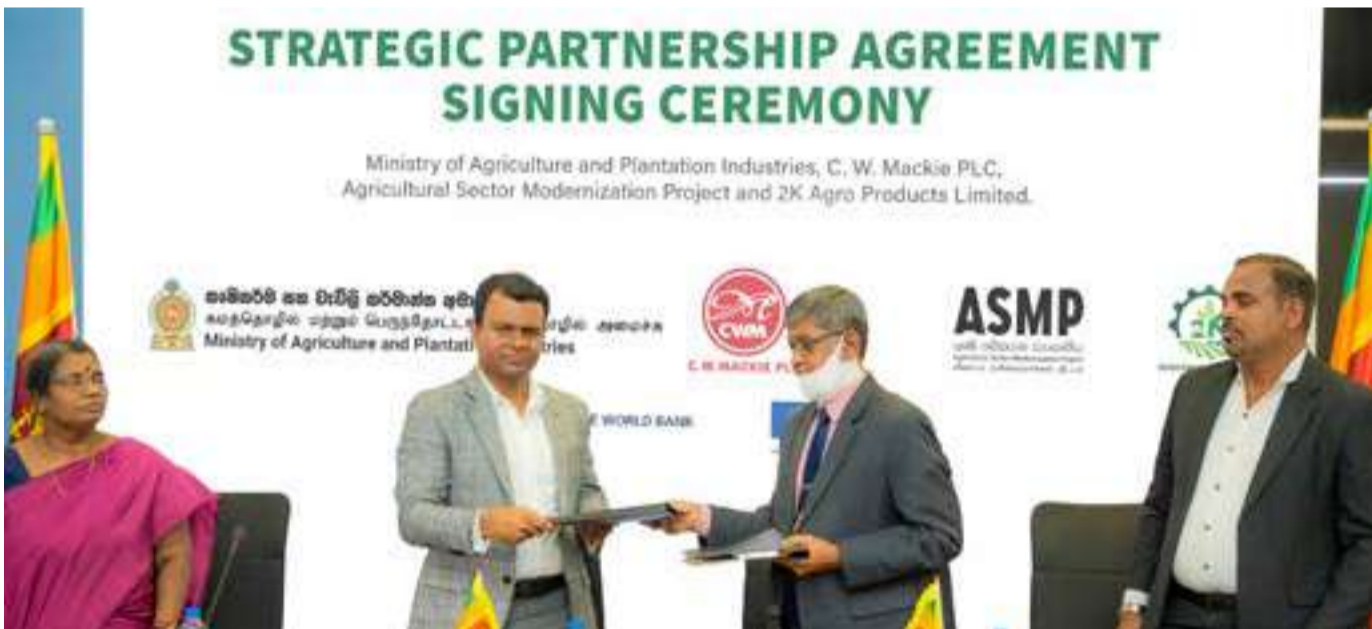
விவசாயத் துறை நவீன மயமாக்கல் திட்டத்திற்காக,